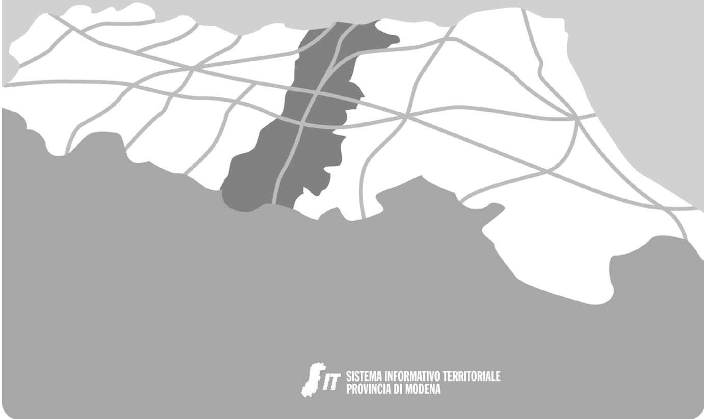
QUADRO D'UNIONE DELLE TAVOLE - SCALA 1:25.000