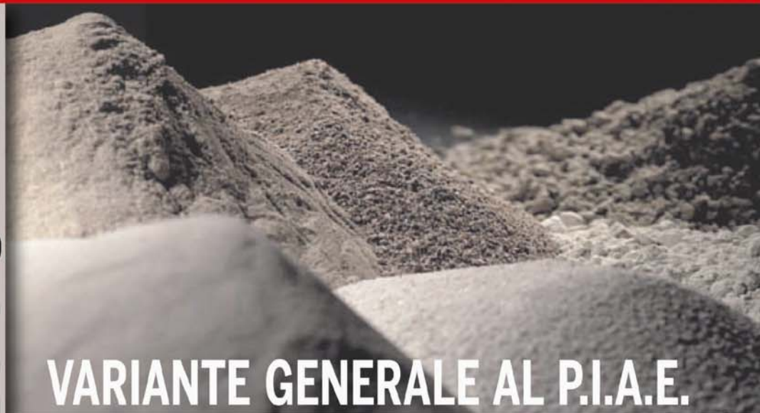
TAVOLA E SCHEDA DI PROGETTO