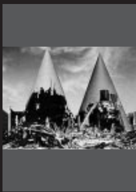
Ryuji Miyamoto Apocalisse dell'architettura. Padiglione espositivo Tsukuba. 1985

ponese verso la natura; il secondo, invece, si dedica alle costruzioni in rovina, ai palazzi in corso di smantellamento, alle aree dismesse, con immagini rigorose e cariche di tensione. Grande rigore formale di sicura tradizione orientale risalta nei nudi e negli still life così come nelle suggestive immagini di Angkor, realizzate Kenro Izu. Con lui, alla Palazzina, Kunié Sugiura e Masao Yamamoto manifestano alcuni aspetti classici dell'arte giapponese: delicatezza nei photogrammes della Sugiura che invade una grande parete con dieci suggestive immagini, i cui temi sono fiori e nature morte. Raffinatezza nella presentazione anche quando questa sembra casuale, come nel caso di Yamamoto, con tre installazioni su tre diverse pareti, opere esposte direttamente a muro, a formare un mosaico composto di piccole immagini che sono quasi ricordi, souvenirs della memoria. Nelle sue rappresentazioni si respira la fragile atmosfera dell'accumulazione di frammenti di nostalgia, ricomposti attraverso la lettura d'insieme delle differenti immagini.