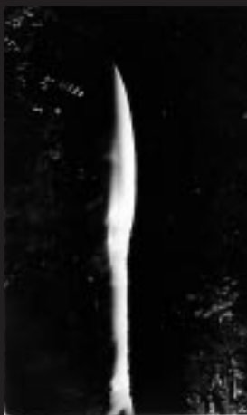
Masao Yamamoto A Box of Ku

Tornando alla mostra di Palazzo Santa Margherita, Toshio Shibata e Ryuji Miyamoto indagano due aspetti quasi opposti, pur orientando entrambi la propria ricerca sulla relazione che esiste tra architettura e spazio: per il primo è il rapporto natura/architettura l'oggetto dell'indagine, ove dighe, ponti, canali, strade paiono appartenere da sempre al luogo (naturale) che le ospita, in un connubio che esalta il grande rispetto giap-