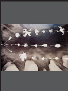
Kunié Sugiura Rashomon, 1995