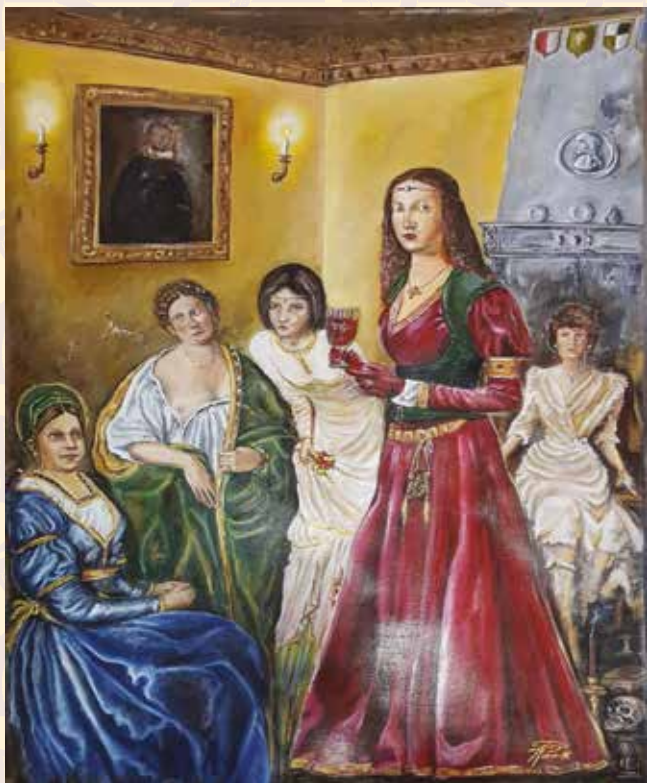
Palio realizzato dagli allievi del Club delle Arti di Finale Emilia